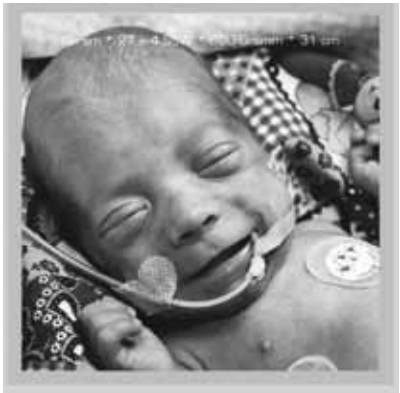
Bilder von Walter Schels "Über|Leben"

Starke Resonanz erfuhr die Fachtagung "Frühgeborene in der Schule - (k)ein Problem?!", die erste zertifizierte Fortbildungsveranstaltung zum Themenkreis "Frühgeborene und Bildung", zu der der Landesverband "Früh- und Risikogeborene Kinder Rheinland-Pfalz" e.V. im Rahmen seiner Reihe Rheinland-Pfalz-Symposium "Kind im Mittelpunkt" eingeladen hatte. Etwa 250 Teilnehmer, darunter Lehrkräfte, Akutmediziner, Pflegekräfte, Schulärzte, Ergo-, Lern- und Psychotherapeuten sowie eine große Anzahl betroffener Eltern und Großeltern verfolgten das kompakte Tagesprogramm am 08.05.2010 in der Ludwig-Eckes-Festhalle in Nieder-Olm. Das starke Interesse der Anwesenden drückte sich auch in der regen Teilnahme an den jeweiligen Frage- und Ausspracherunden im Laufe des Tages aus. Begleitend zu den theoretischen Ausführungen hatten die Teilnehmer die Möglichkeit, sich darüber ins Bild zu setzen, was es bedeutet, frühgeboren zu sein. Im Tagungssaal war ein Ausschnitt aus der Fotodokumentation "Über|Leben" des renommierten Fotografen Walter Schels zu sehen, der den Überlebenskampf extrem frühgeborener Babies auf einer Hamburger Intensivstation fotografisch in sehr berührenden Bildern eingefangen hat. Reissäckchen halfen dabei zu erspüren, wie schwer bzw. leicht die Kinder ins Leben starten mussten.